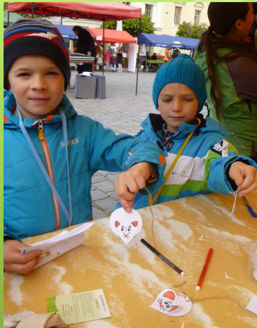
Výroba papírové želvičky a myšky.