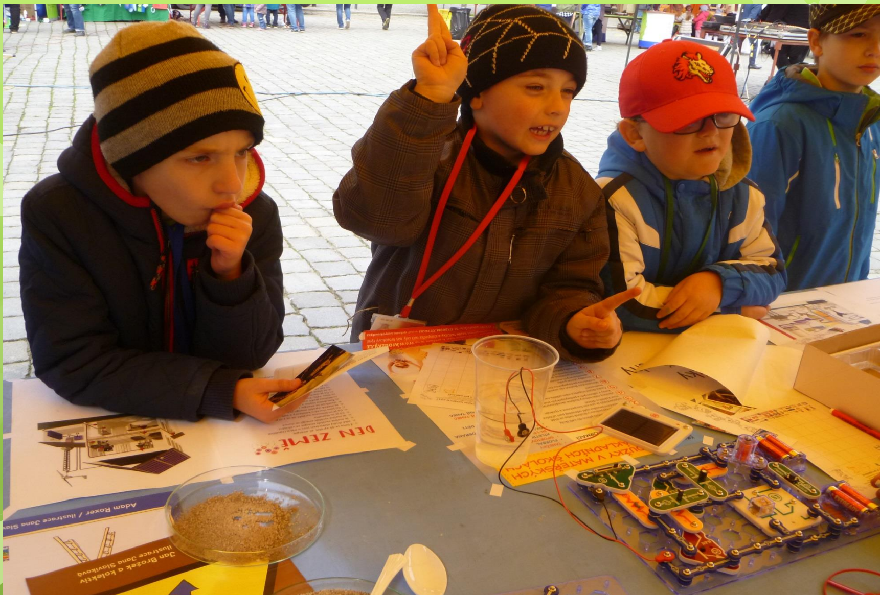
Pokus s elektrickou energií.