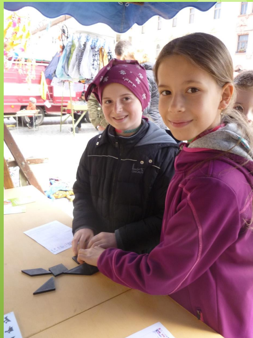
Kresba poslepu a složení hlavolamu.