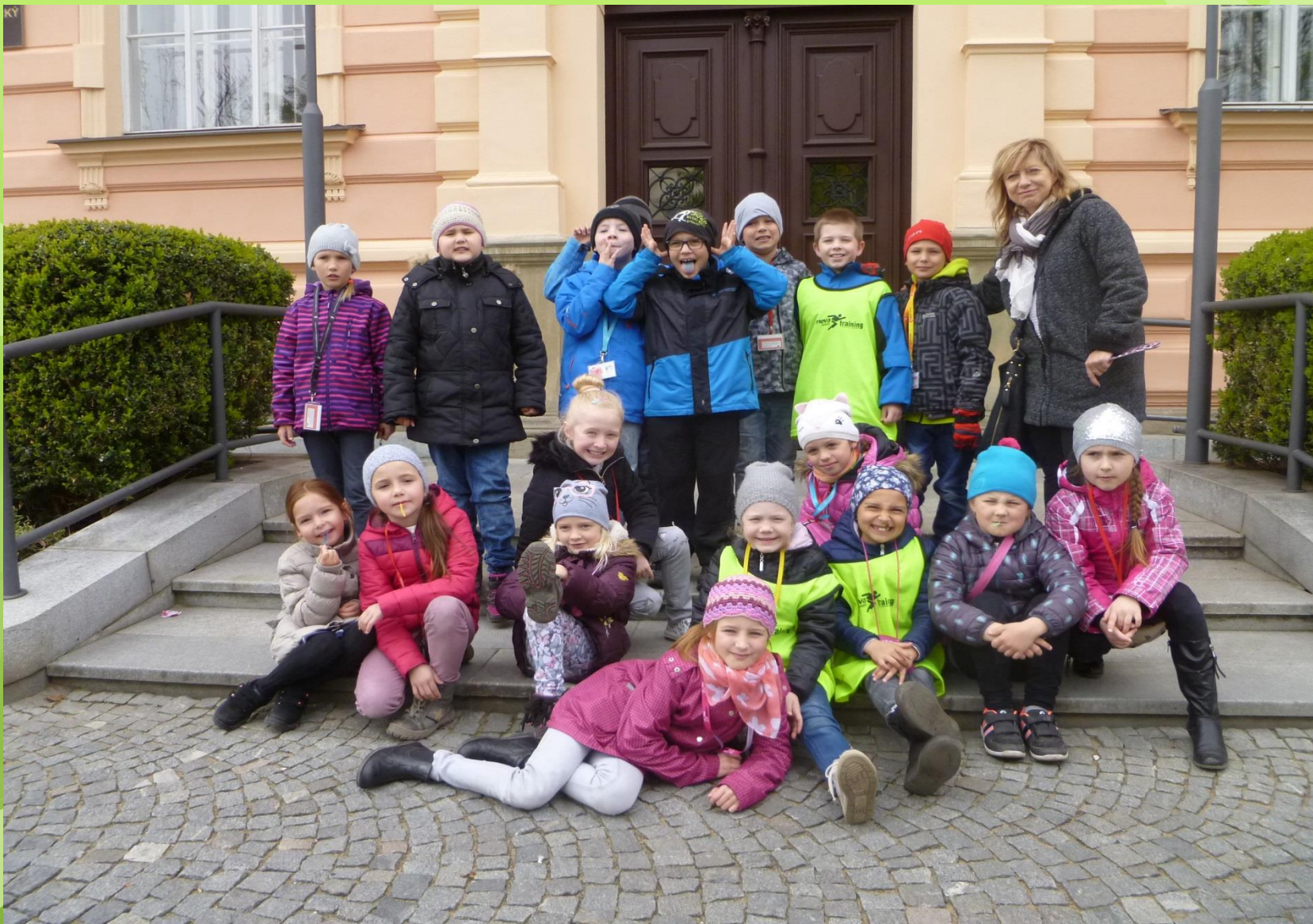
Před Krajským úřadem v Pardubicích.