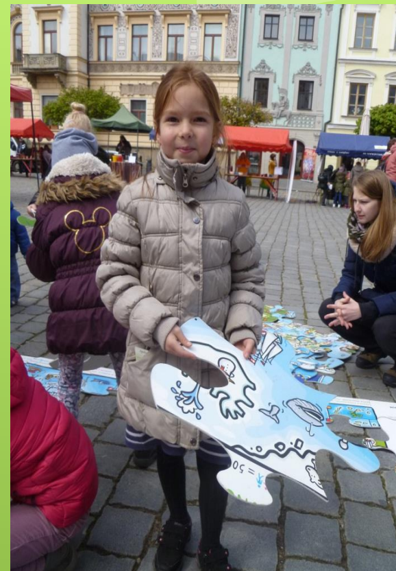
Skládání puzzle mapa Evropy.