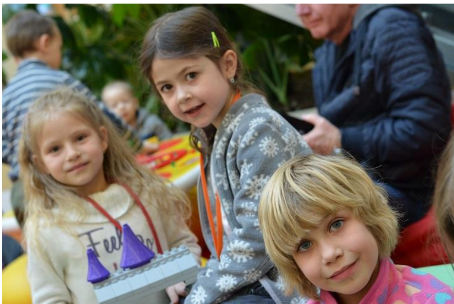
Holky staví z LEGA hrad.