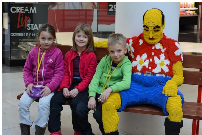
Děti našly nového parťáka.