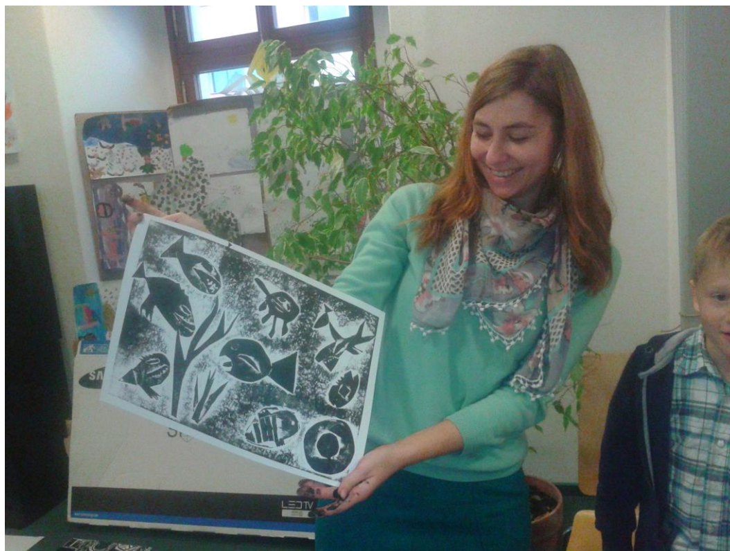
Lektorka z VČG s jednou ze skupinových prací vytvořenou technikou tisk z koláže

Dne 13.11.2014 se naši třetíáci zúčastnili programu ve Východočeské galerii – Tisknu, tiskneš, tiskneme.. Měli jsme o tomto programu skvělé reference od našich žáků ze 4. a 5.třídy a od jejich paní učitelek..