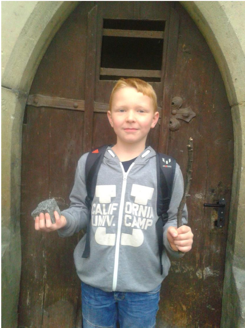
Král s žezlem a jablkem...