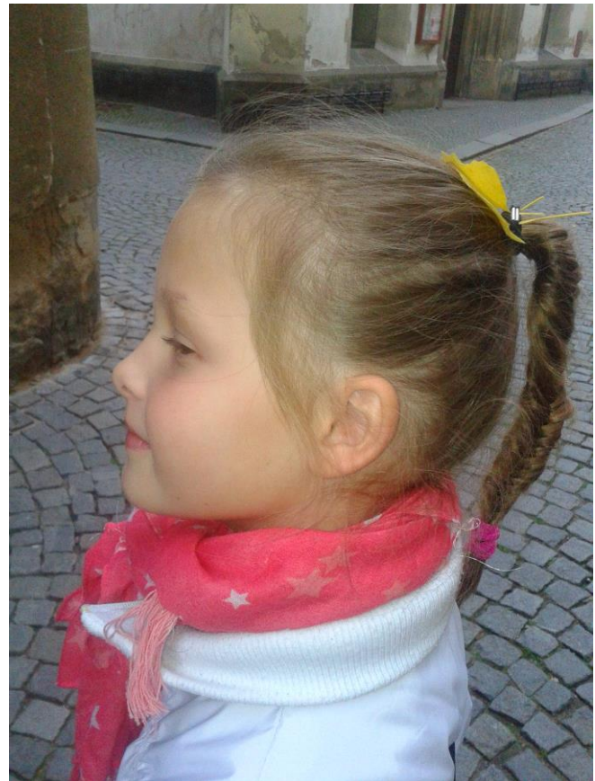
Japonka s vějířem z listů jinanu ve vlasech

A již vcházíme do podivuhodné budovy Domu U Jonáše , kterou děti mají rády nejen pro výstavy, jichž jsme se zúčastnili, ale zejména pro to, že ve štítu je Boží oko, které dává pozor na všechny lidi, kteří se pohybují po náměstí. :-)