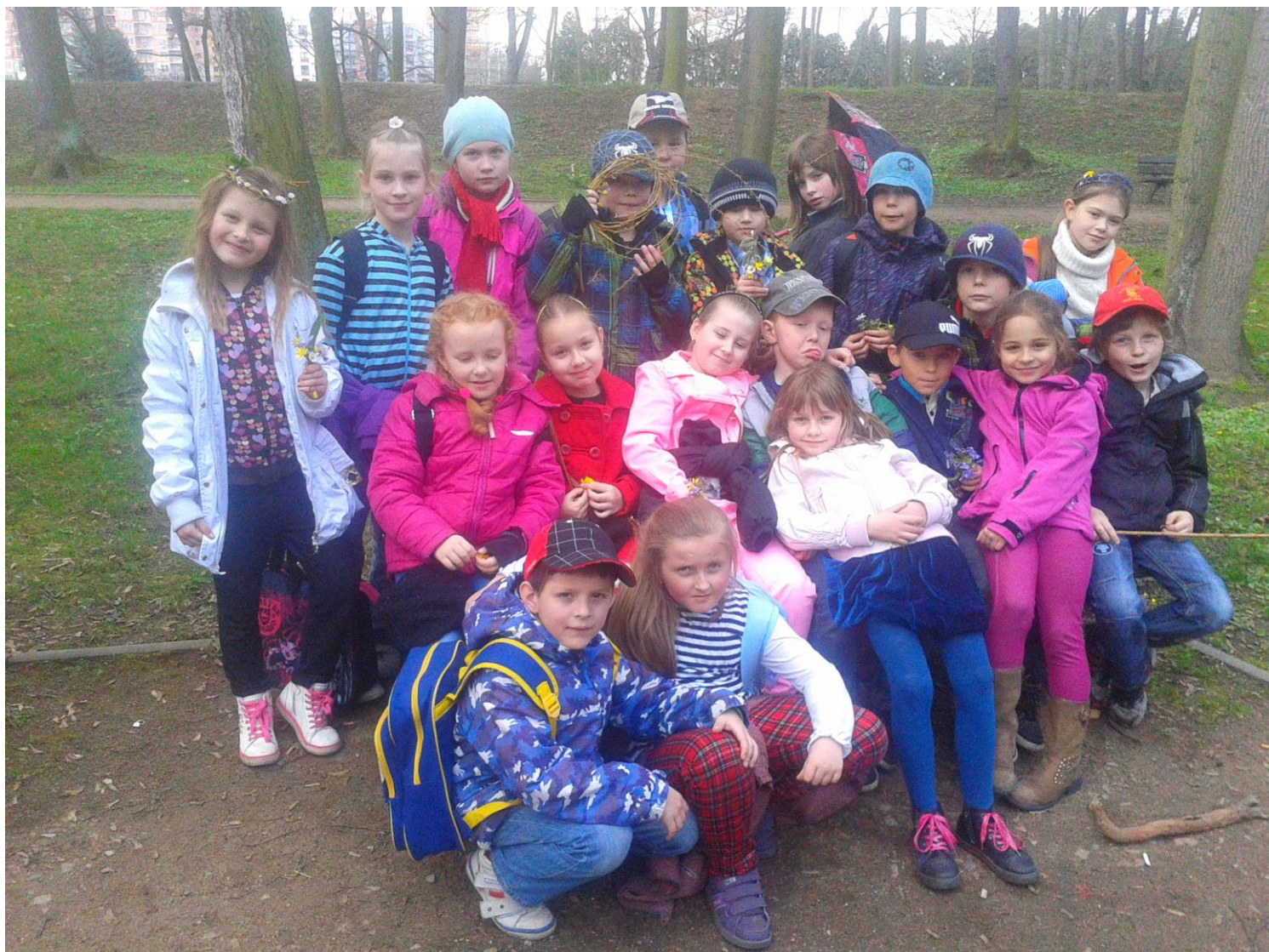
Těšíme se na další podobné akce.

My jsme pilní ve škole stejně jako včelky v úle