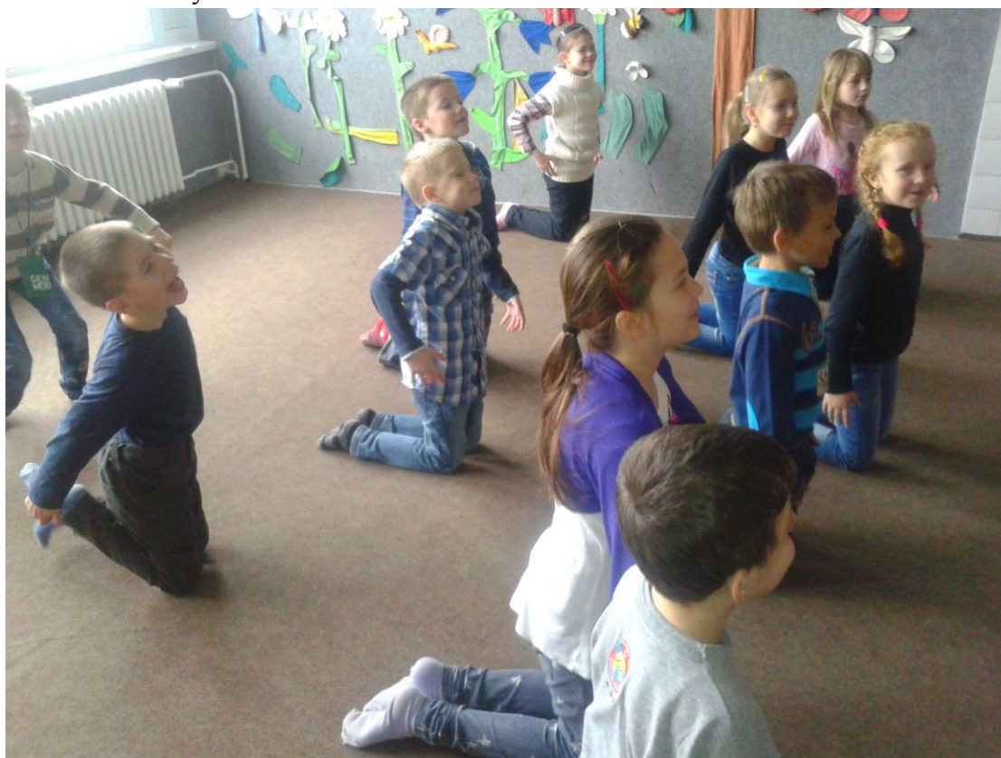
Mladé včelky v buňkách rovnají křídélka